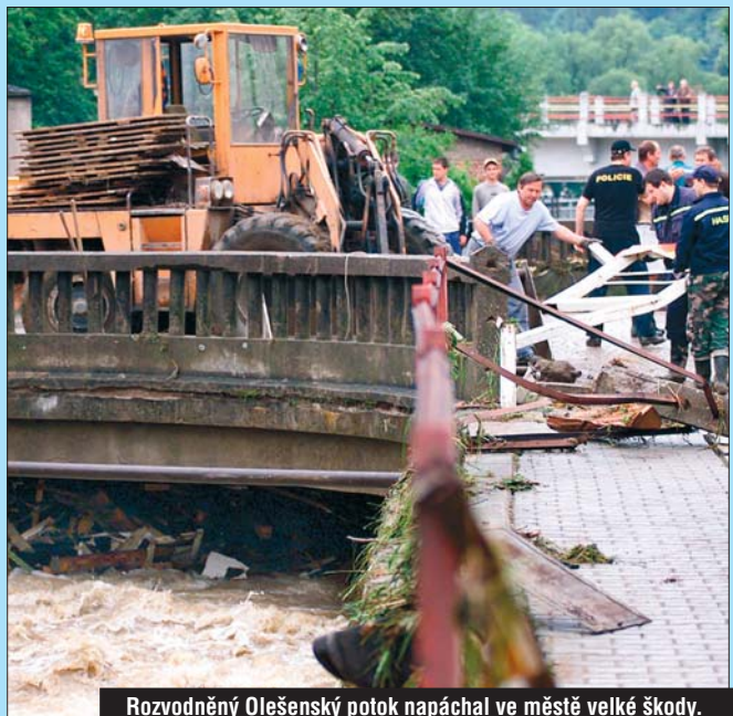
Rozvodněný Olešenský potok napáchal ve městě velké škody.

Velká voda vtrhla do Ledče 10. června a způsobila škody za zhruba 35 milionů korun. Aby se podobná situace neopakovala, připravilo město návrh protipovodňových opatření, mezi které patří poldr, zásady hospodaření na okolních zemědělských pozemcích a přestavba mostků a dalších staveb na Olešenském potoce.